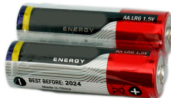
图 3 电动机及电池外观（供参考）